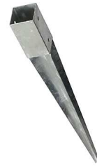
Boîtes avec pointes pour 90/90