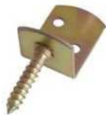
Équerres pour fixation palissades